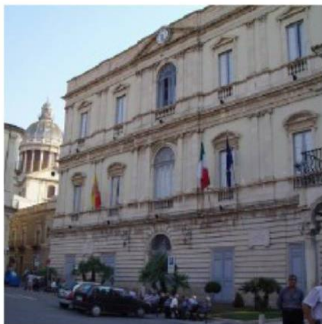
Palazzo di Città a Comiso

“Solo per le rigorose regole da applicare ai bilanci comunali – spiega Assenza – il Comune di Comiso a fine 2020 risulta in disavanzo mentre nei fatti, come bilancio di competenza, fa registrare un risultato positivo. Si è dovuto, infatti, in particolare, accantonare un importo di circa 18 milioni di euro ottenuto dalla Cassa Depositi e prestiti come anticipazione di liquidità a fronte di